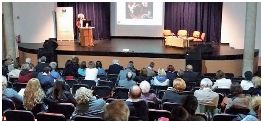
Nagy érdeklődés kísérte a műtárgyhamisítási konferenciát Kaposváron