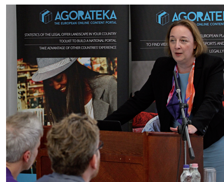
Az Agorateka projekt bemutatása az SZTNH-ban

A projektről bővebb információ elérhető az Agorateka honlapján: https://agorateka.eu/ea/ .