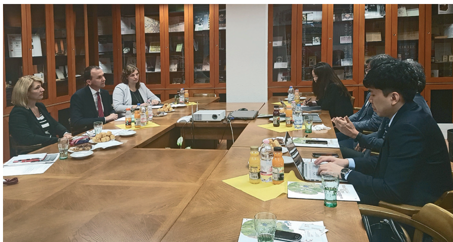
A magyar és a koreai delegáció tárgyal az SZTNH-ban

A két delegáció budapesti megbeszélésén bemutatásra kerültek a hazai a technológiatranszfer-kultúra fejlesztésének és promotálásának lehetőségei az innovatív magyar kis- és középvállalkozások körében. A tárgyalófelek felvetették a koreai tapasztalatokon alapuló magyar–koreai együttműködés lehetőségét a témában.