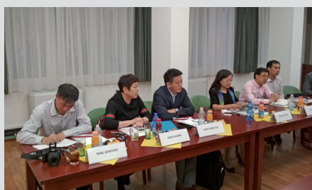
A kínai delegáció az SZTNH-ban

A delegáció tagja volt még többek között a tartomány egyik kiadóvállalatának, illetve