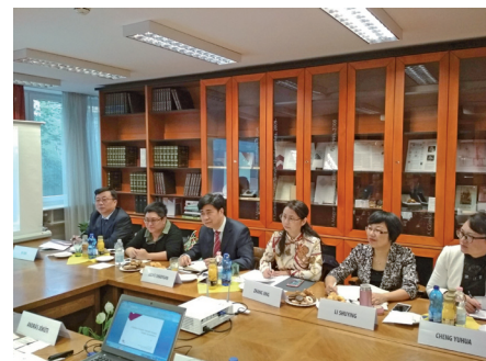
A magyar és a kínai delegáció megbeszélése az SZTNH-ban