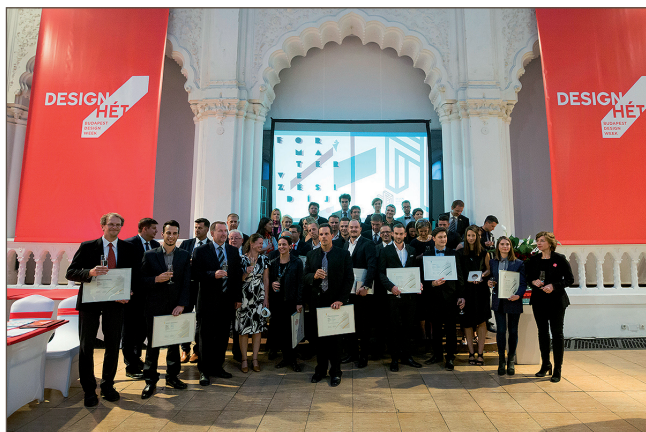
A díjazottak a díjátadókkal és a kiállítás az Iparművészeti Múzeumban