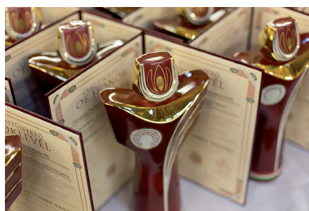
A Magyar Termék Nagydíjak és a díjátadó a Parlamentben

A Kiírók Tanácsa egyetértett abban, hogy 2016-ban is megvalósult a Magyar Termék Nagydíj Pályázati Rendszer célja; elismerést nyert a kimagasló árú és szolgáltatások magas minőségi színvonala. A rendszer továbbra is hozzá kíván járulni a pályázaton minősített szerzett termékek gyártóinak piaci munkájához