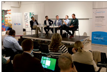
A V4 képviselői megosztották befektetői tapasztalataikat