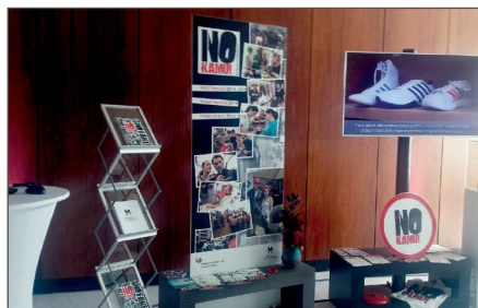
HENT-kiállítás a WIPO-ban

forgatott videók is bemutatásra kerültek a kvízekkel, a hamisítás elleni szóróanyagokkal és a fesztiválokon osztott kisebb ajándéktárgyakkal együtt. Helyet kapott egy kiállítási vitrinben az igazi magyar ikon, a bűvös kocka is, ahol az eredeti mellett a hamisítványok is ki lettek állítva, szemléltetve az eredeti és a hamis közti – helyenként nehezen észrevehető – különbségeket.