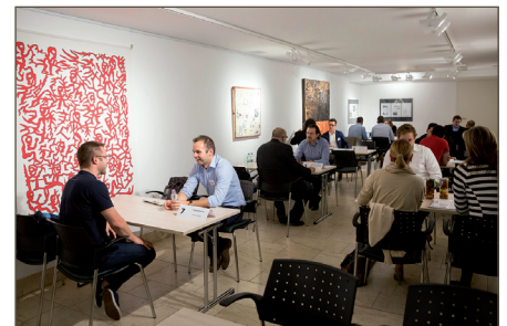
Sokan kihasználták a személyes konzultáció lehetőségét