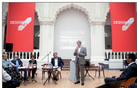
„A design és a társadalom kölcsönhatása a bútorigarban” című rendezvény az Iparművészeti Múzeumban

A Design Hét Budapest az idei évben Ionna Vautrin és Benjamin Hubert sztárdesignereket látta vendégül. A Moholy-Nagy Művészeti Egyetem Auditóriumában megrendezett telt házas prezentációk a résztvevő látogatók elismerése mellett kiemelt médiavisszhangnak is örvehdettek. A médiapartnerekkel való aktív együttműködés eredményeképp a fesztivál programjai több mint százötven megjelenést eredményeztek - a fesztivál aktív jelenléte az online és offline sajtóban, a kulturális televízió- és rádióműsorokban jelentősen hozzájárult a programok láthatóságához és népszerűségéhez.