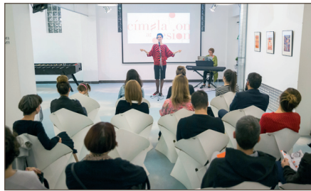
Egy tárlatmegnyitó – két érzék

A kamarakiállítás a Design Anatomy szlogen mentén, több szállal is kapcsolódva az öt érzék tematikához, a grafikai tervezés egy speciális, kevésbé ismert területére: a kottacímlapok tervezésébe enged betekintést. A különleges, 20. századi kottacímlapok az egykori kottanyomda épületében működő Loffice-ban kerültek bemutatásra, ahová ezúttal visszatértek a kottaké-