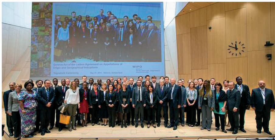
A diplomáciai értekezlet résztvevői

A diplomáciai értekezlet dokumentumai elérhetőek az alábbi linken: www.wipo.int/meetings/en/details.jsp?meeting_id=35202 .