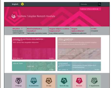
A megújult SZTNH honlap

nek nem feltétlenül célunk az ismerkedés első fázisában a szabadalmaztatás folyamatát felvázolni. Emiatt a szempont miatt az új portálon észrevehetően elválik egymástól egy köteg új bevezető oldal, hangsúlyozottan tematikus kiemelés a régi, erőteljesen szakmai jellegű releváns tartalmaktól – ezen utóbbi strukturált tartalmat „Szakmai felhasználóknak” útvonal mögé helyezte a fejlesztő csapat. A „Szakmai felhasználóknak” szánt oldalakat a korábbi honlapról emelte át a munkacsoport: tartal-