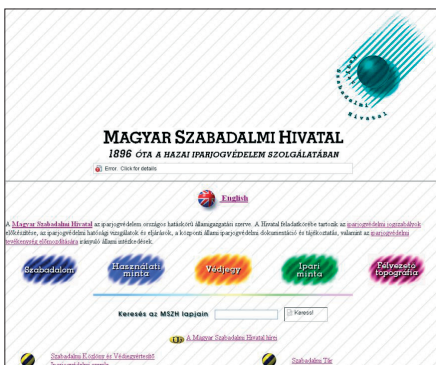
MSZH honlap 1996–2002

A portál indulása óta szerzett első tapasztalatok azt mutatják, hogy egy jól előkészített, a felhasználók szokásait és igényeit is figyelembe