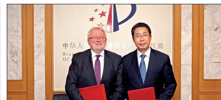
A két hivatal elnöke aláírta a megállapodást

tését; az intézmények közötti információcserét a két ország szellemi tulajdon-védelmi rendszerével kapcsolatos fejleményekről, jogszabályi változásokról, a szabadalmi vizsgálatok során szerzett tapasztalatokról; a visegrádi országok és Kína közötti együttműködés erősítését, valamint a szellemi tulajdon-védelemhez kapcsolódó képzéseket.