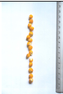
1. HMY5380 kakorlecafaja termése