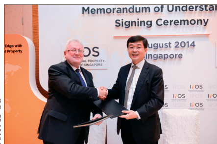
Az IPOS-SZTNH megállapodás

gapúri törekvéseket a Szabadalmi Együttműködési Szerződés szerinti nemzetközi kutatóhatósági szerepvállalásával kapcsolatban.