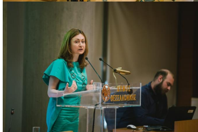
fotók: Hellenic Design Center