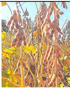
3. BSF 18 43/3 szója fajta, érett hüvely barna