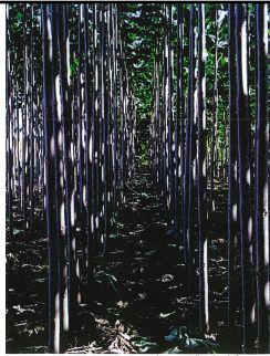
1. CONTINENTAL E. fajtanévű császárfa