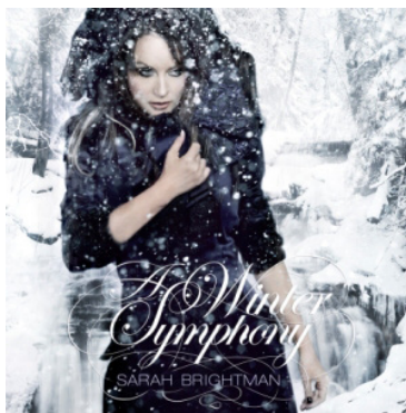
1. ábra: Sara Brightman – Winter Symphony album borítója, forrás: https://sarahbrightman.com/discography/a-winter-symphony/ .