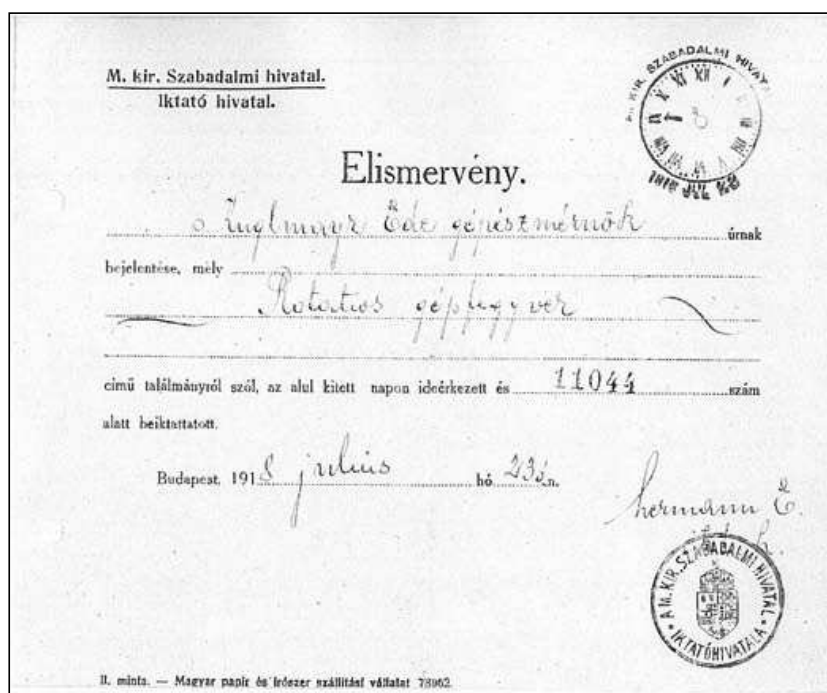
5. ábra: A M. Kir. Szabadalmi Hivatal iktatóhivatalának elismervénye

A megadást követően a szabadalom megjelent nyomtatásban, azonban vitás kérdésekben az eredetileg benyújtott irat számított „perdöntőnek”. Az okiratok az irattárban, a nyomtatott leírások a levéltárban kerültek elhelyezésre. Milyenek álmodta meg ezt a dokumentumtárat az egykori segédhivatali főigazgató? Nos, a szabadalmi levéltár mindennap nyitva tartott délelőttönként, lehetőséget adva az ügyfeleknek, hogy tájékozódjanak és a levéltáros által hitelesített másolatokat kaphassanak. Bejelentés után lehetséges volt a megtekintés, hiszen a Magyarországon uralkodó tiszta felszólalási rendszer ezt eleve szükségessé is tette. „Papiron és irónon” kívül semmi egyéb nem lehetett az ügyfél kezében. Nem másolhatott, csupán jegyzeteket készíthetett. Aztán, a felszólalási határidő lejártát követően, az ügy összes addig beérkezett irata hivatali átadásra került, és a közzétételig mind a betekintés, mind a másolatkiadás tilossá vált. „Ennek a levéltárnak a kezén a szabadalmi hivatalhoz érkezett csaknem minden bejelentés legalább is kétszer, megsemmisítési és megvonási keresetek ugyanannyiszor fordulván meg, tekintettel arra, hogy a kitett találmányi leírásokat betekintő közönséget is ezeknek kell kiszolgálni és ellenőrizni, felelőségük igen nagy, teendőjük pedig oly sok, hogy azt csakis a legmegfeszítettebb munka mellett képesek elvégezni.” 5