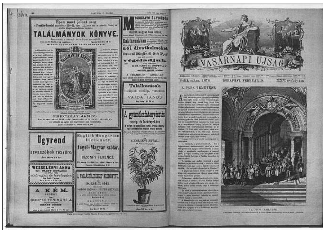
4. ábra: Részlet a Vasárnapi Ujságból