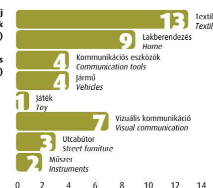
Distribution of exhibited applications by theme (pieces)