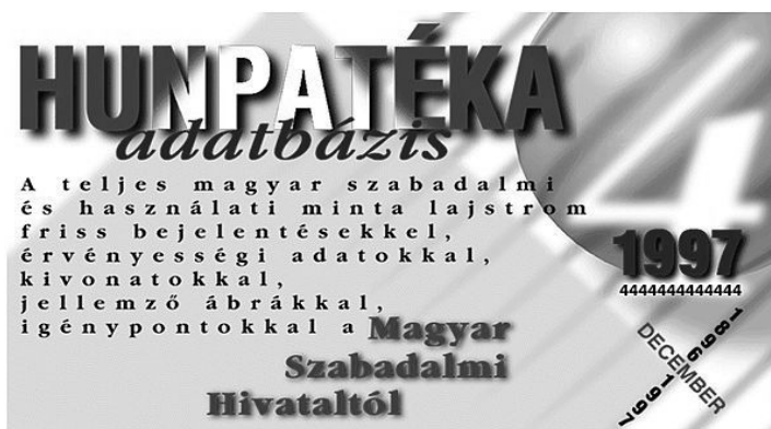
A HUNPATÉKA lemez borítója

A hivatal a szabadalmi információkat 1987 és 1993 között a HUNPADOC adatbázisban dolgozta fel, amelynek optikai lemezes változata is megjelent. 1994-től a jelentősen kibővített adatbázis HUNPATÉKA néven CD-ROM hordozón jelent meg. A retrospektív feldolgozás eredményeként a HUNPATÉKA a hivatal 1896. évi megalakításától kezdődően az összes magyar szabadalom bibliográfiai adatait és jellemző ábráit tartalmazta, illetőleg az újabb szabadalmi bejelentésekről közzétette a törvényben meghatározott információkat. 128