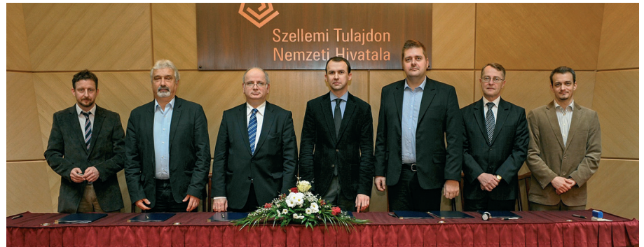
Az aláírás résztvevői

A regionális innovációs ügynökségeknek változatlan célja, hogy – 2005 óta országos hálózatként működve – elősegítsék az adott régió nemzetközi versenyképességének a növekedé-