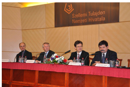
A kerekasztal-beszélgetés résztvevői

égetése mérhető és minden valószínűség szerint veszedelmes hatást gyakorol az éghajlatra. Ha el akarjuk kerülni a veszélyes mértékű éghajlatváltozást, azonnal fel kell hagynunk a fosszilis