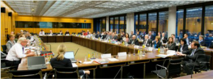
EPO News Symposium on Article 123(2) EPC (2014. február 7.)

The patent professionals advocated less formalism in the assessment of Art. 123(2) EPC, and more consideration of the actual invention, more in the sense of what a skilled person could understand.